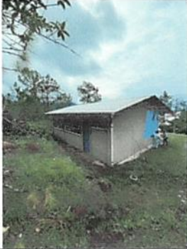
Foto1: PINTURA EXTERIOR